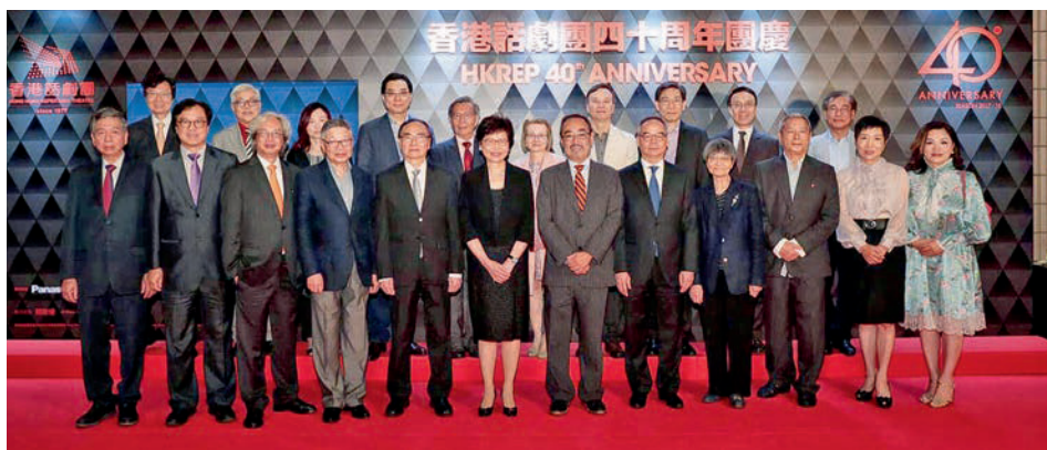
▲胡偉民以香港話劇團榮譽主席身份與行政長官林鄭月娥及民政事務局劉江華局長共同出席話劇團四十周年酒會。

於2015年，他引薦香港印度社團總會與保良局合作發展兒童與長者日間護理中心及家庭輔導中心，以幫助社區有需要人士及少數族裔。中心將設於九龍渡華路，地盤面積2,100平方米，現正籌劃興建。保良局將負責中心日後的營運與管理。