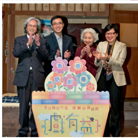
▲胡偉民與時任教育局楊潤雄副局長（左二）、梁愛詩博士（右二）及時任民政事務局許曉暉副局長（右一），一同為「戲有益」擔任啟動禮嘉賓。